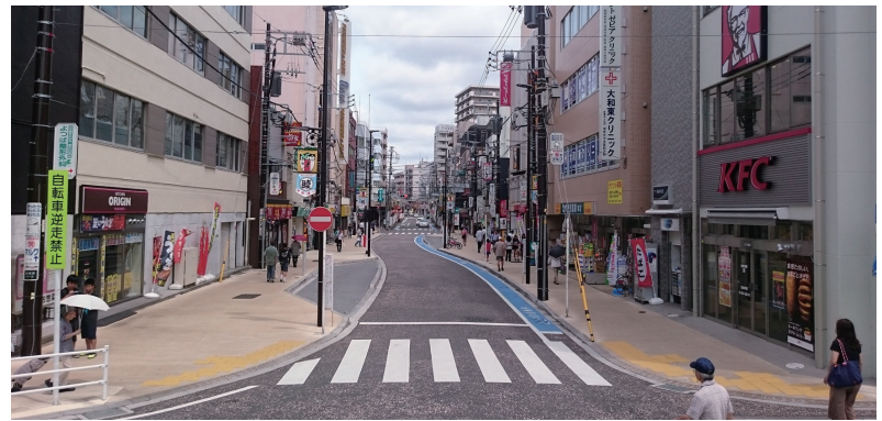
整備により歩道が広がるなど、安全性が向上

これにより、歩行者や自転車、自動車の安全性の向上、路上駐車抑制などが期待できます。