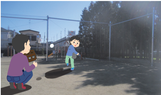
市消防本部近くの「ぼ～る遊びもできる公園」

近年、気軽にボールで遊べる場所が少なくなっています。そのため、市は「ボール遊びもできる公園」の整備を進めています。これまでに、つきみ野5号、善光明、宮久保2号の各公園に防球ネットの設置を完了。深見西には「ぼ～る遊びもできる公園」を新設しました。さらに今年度中に、市北部と中部に1公園ずつ追加整備予定です。